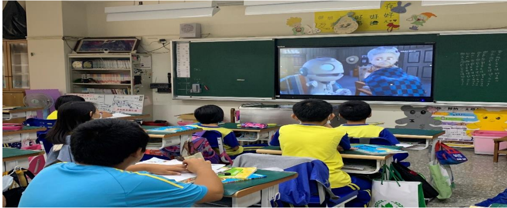
第一學期家庭暴力防治宣導