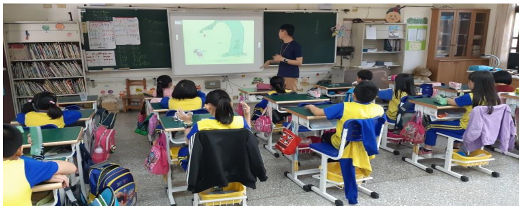
第二學期兒少保護宣導