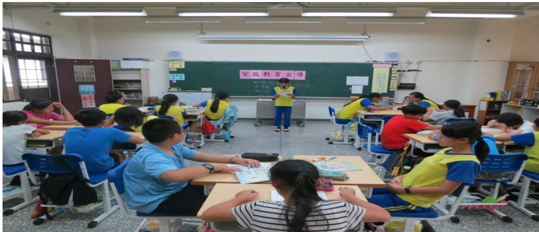
第一學期子職教育宣導